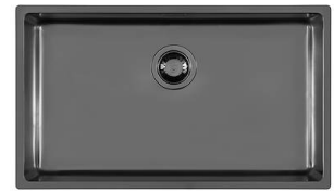
Évier KE Filotop Gun Metal 2157 056