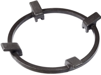
Support de Wok en fonte 9601 727