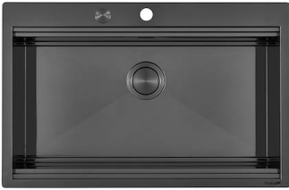
Évier Milanello Gun Metal workstation 1034 056